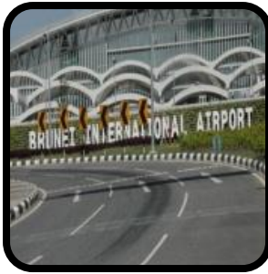
Mana-mana lapangan terbang termasuk premis-premisnya.