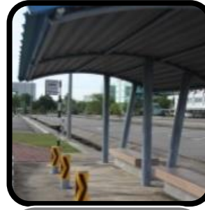
Terminal pengangkutan awam, tempat perhentian bas atau teksi