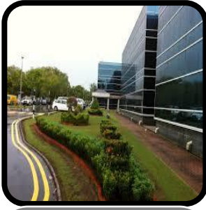
Premis Pejabat (Bangunan & mana-mana tanah bersebelahan yang digunakan berhubung dengannya)