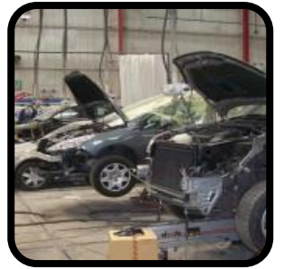
Kilang & Bengkel