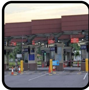
Mana-mana pos kawalan imigresen termasuk premisnya