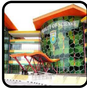
Mana-mana kawasan dalam institusi pendidikan tinggi.