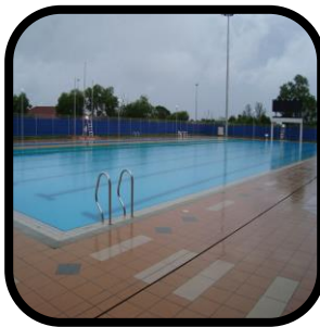
Kolam renang awam, Gimnasium, Pusat aerobik dan kecergasan