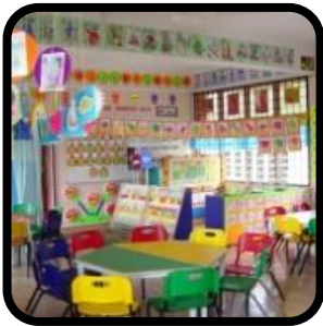
Mana-mana kawasan dalam sesebuah tadika