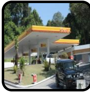
Mana-mana kawasan di dalam sesebuah stesen minyak.