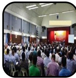
Mana-mana kawasan yang digunakan bagi sebarang aktiviti perhimpunan dalam bangunan