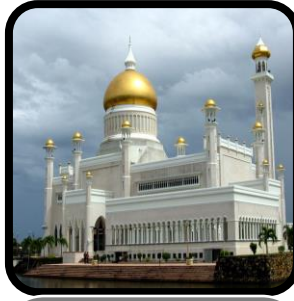
Bangunan atau tempat awam yang digunakan bagi maksud-maksud keagamaan