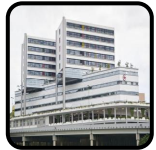
Hospital, klinik dan rumah penjagaan.