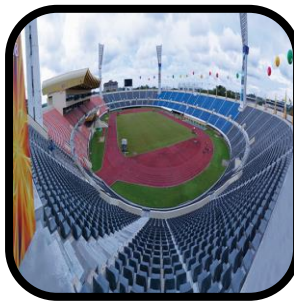
Arena sukan, Stadium sukan atau mana-mana premis yang digunakan bagi aktiviti sukan