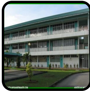
Mana-mana kawasan dalam institusi pendidikan.