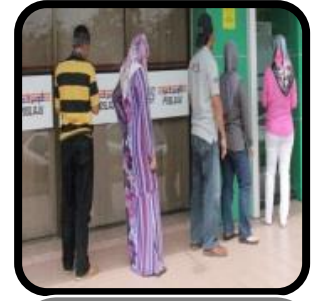
Mana-mana tempat awam di mana 2 orang atau lebih beratur