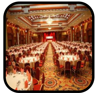
Dewan atau Bilik Upacara (termasuk yang terletak dalam hotel sama ada atau tidak ia digunakan untuk mesyuarat, seminar, pameran atau menghidang makanan)