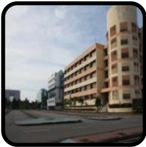
Premis Kerajaan (Bangunan & mana- mana tanah bersebelahan yang digunakan berhubung dengannya)