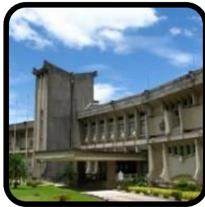
Muzium awam dan galeri seni awam