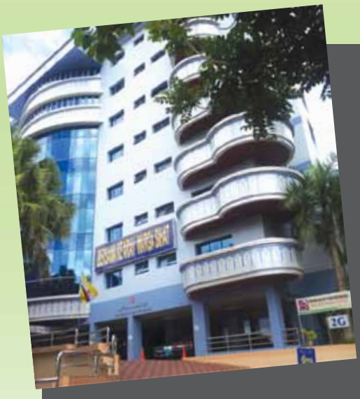
Pusat Kesihatan Bandar Seri Begawan

Pusat Kesihatan Bandar Seri Begawan telah diakreditasi oleh pihak United Kingdom mulai bulan Ogos 2014 sebagai Klinik Penyaringan Penyakit TB untuk permohonan visa ke United Kingdom.